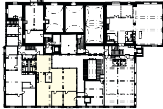
Übersicht Ebene C